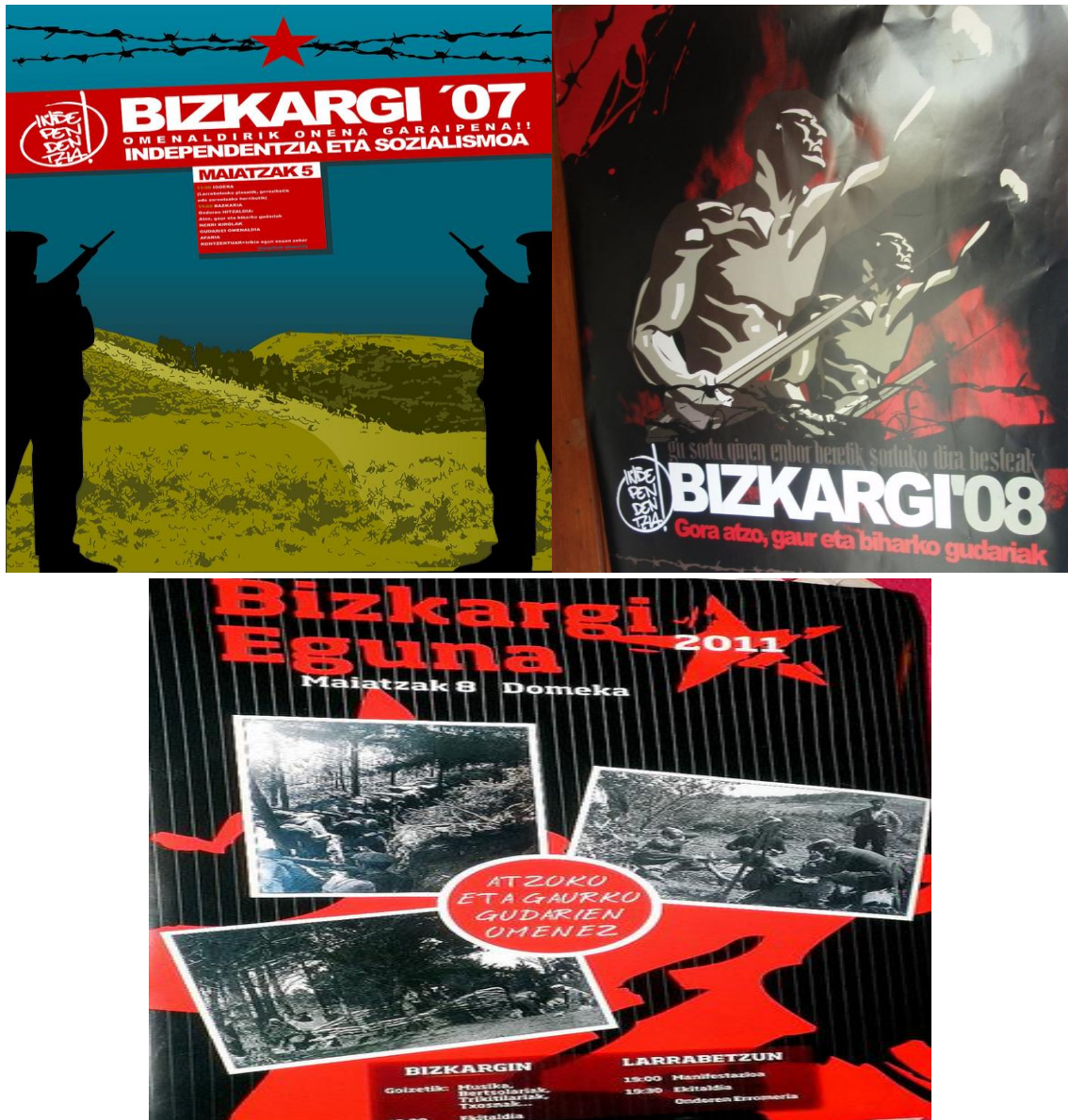
Document 1. Tracts de convocation du Bizkargi Eguna, 2007, 2008 et 2011

D'un point de vue terminologique, le slogan du tract de 2007, « Omenaldirik onena garaipena ! Independentzia eta sozialismoa » signifie « Le meilleur hommage, la victoire ! Indépendance et socialisme ». Il établit ainsi un lien clair entre les combattants d'hier et d'aujourd'hui, dont les luttes seraient liées par l'idéologie socialiste et par une même quête d'indépendance pour le peuple basque. L'utilisation du terme « hommage » fait clairement référence au passé et à la remémoration nécessaire, là où celui de « victoire » suggère la perpétuation contemporaine de la lutte. Dans le même ordre d'idée, le tract de 2008 célèbre les racines et l'appartenance commune des gudarisk d'hier et des martyrs contemporains d'ETA, stipulant « Gu sortu qinen enbor beretik sortuko dira besteak. Gora atzo, gaur eta biharko gudariak », ce qui illustre bien cette volonté d'établir une continuité historique, puisque cela signifie « Du même tronc duquel nous sommes nés, naîtrons les autres. Les gudarisk, debout hier, aujourd'hui et demain ». Quoique de manière indirecte, il est néanmoins établi une filiation commune entre les nationalistes de la guerre civile et les terroristes d'aujourd'hui qui lutteraient pour la même cause indépendantiste. Cette ancrage historique de la lutte indépendantiste justifierait d'autant plus la perpétuation de celle-ci tant « aujourd'hui » que « demain ».